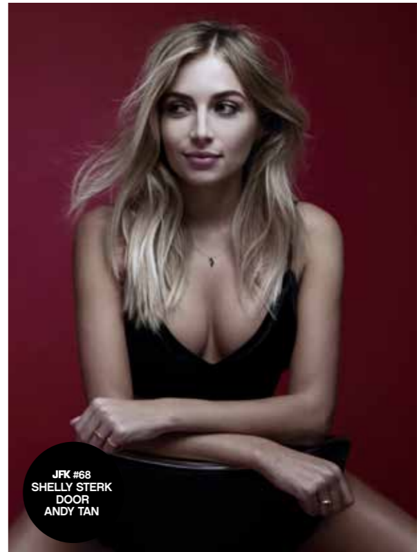
JFK #68 SHELLY STERK DOOR ANDY TAN